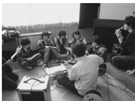
写真3 グループ毎に歌唱練習する様子