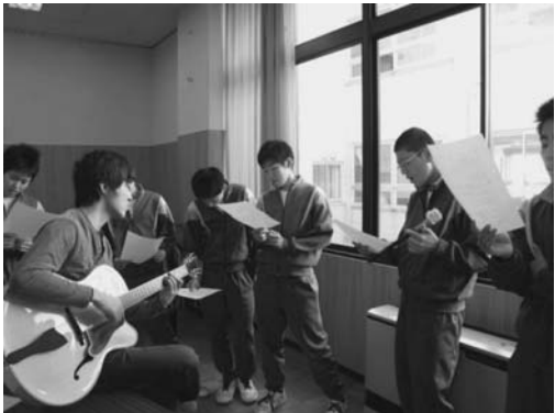
写真2 左は全体、右はグループでの歌唱