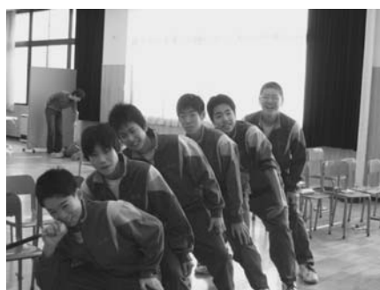
写真4 EXILEの動きを取り入れたパフォーマンス