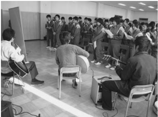
写真1 バンドの生演奏に合わせて歌唱する生徒たち