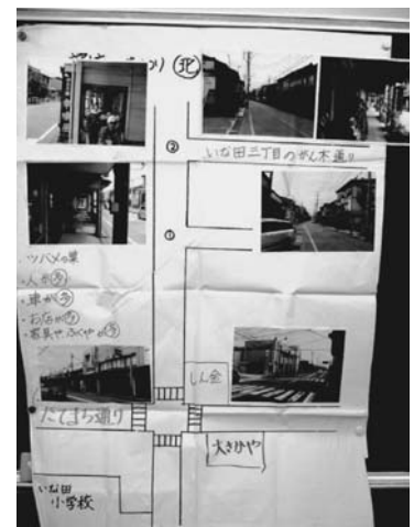
写真1 授業で使った地図