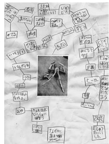
資料3 (イメージマップ)

児童は自由に発想し、とても楽しいストーリーができあがった。イメージマップだけを使って「私の流木ストーリー」を書いた児童もいたほど、メモの内容は豊かであった。