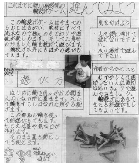
資料9 (清書した作品説明の文章)