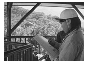
写真3 山頂駅から南魚沼市を眺める

まず、5月と10月に遠足を設定し、私たちが住んでいる栲笹地域が一望できる山(樽山)に登り、春と秋による景色の違いを見比べた。児童は、初夏の緑と秋の紅葉に染まる色の違いに気づき、それぞれの季節の素晴らしさを感じることができた。同じ地点から季節を変えて景色を眺めることは、違いを見付けやすくて大変有効だ。