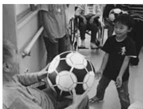
写真6 楽しくボール遊び

福祉・ボランティアに関しては、平成20年度までは特別養護老人ホームに年2回訪問していたが、もっと様々な人とかかわりをもつことを目的に、平成21年度から老人ホームと特別支援学級とを1年交替で訪問することにした。