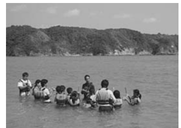
写真4 沖縄の海でシュノーケル体験

自然環境については、想像以上の海的美しさに感激したり、沖縄にしかない動植物を見たり触ったり、海や川でたくさん泳いだりと、有意義な活動ができた。