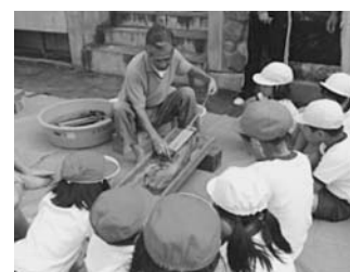
図1 苧引きを教えていただく

また、報道関係に連絡して、活動を新聞記事にしてもらおうことも行った。その際、児童は記者にインタビューされ