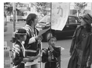
写真5 チラシを渡して米を宣伝

米販売は、例年11月の宿泊体験学習の時に東京・銀座で行う。キャリア教育の一環として米販売をしているが、自分たちが作った米をどのようにアピールして客に買ってもらうかを、全校児童で話し合う。「私達が作った米がなぜおいしいのか」を、これまでの活動をもとに考えさせる。そこで、「水がいい」、「空気がいい」、「適した温度になっている」など、環境に関する答えが出てくる。その後、販売する時に客に渡すチラシを作成する。その際、私たちの米は環境の良い地域で育ったことをアピールしたり、児童が体験した田植えや稲刈り、脱穀などの生産過程が分かるようにしたりしながら、作成していく。