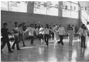
図2 たくさんの外国人と交流活動

ることがあるので、今回の活動で感じたことや活動の意義など、自分の思いを相手に分かりやすく伝えられるようにしておく必要がある。そのために、思ったことや感じたことなどを自分の言葉で言わせる機会を、毎回の総合や他教科で頻繁に取り入れている。