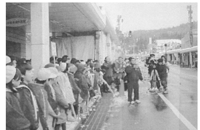
【写真4 街角で元気を】

地域の商店街では、店舗再開をした所もあれば、依然として被災当時のまま手付かずの所や取り壊して撤退する大型スーパーもあり、悲喜こもごもであった。そこで、年の瀬を迎えたこの時期に、被災しながらも懸命に学校生活を送っている児童の姿を地域住民に見てもらうことで、地域に活力を与えることが可能ではと考え、終業式を当校から歩いて5分の地元商店街アーケード内で行うことにした。初めに校長の挨拶、次いで商店街組合長K氏の激励の言葉、そして学年プラカードを先頭にアーケード内を練り歩き、「地震に負けずにがんばってください。」「新年は勉強をもっともっとがんばります。」などと事前にかいた約1800枚のメッセージカードを携えて、街行く人々や商店主に手渡していった。「子どもたちのにこにこした笑顔がかわいらしかった。大人も頑張らねばという気持ちが沸いてきた。」と、ある店主は歓迎していた。「たなが少しこわれていたけれど、品物がた