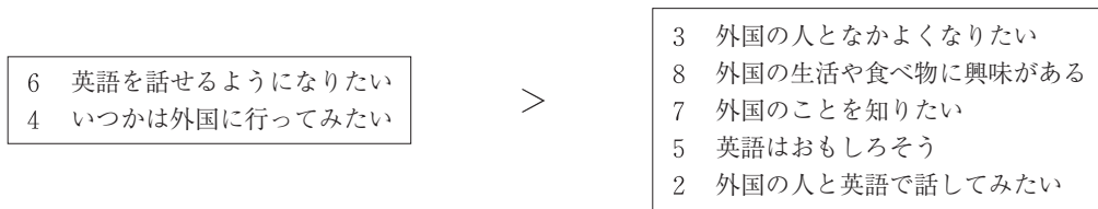
図8：6年生のLSD法による8項目の多重比較② (MSe=0.97, 5%水準)