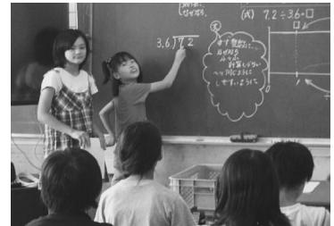
図3 ペア学習の様子

算数では、子どもに安心感と連帯感をもたせながら言語活動に取り組ませるため、ペア学習を多く取り入れた。(図3) 隣同士で考えを伝え合うことで、自信がもてなかった自分の考えが確かなものとなったり、新たな考え方や表現の仕方を知ったり、自分の考えがより深くなったりすると考える。ペアで意見交流させた後は、「二人の考え」という形で黒板に出て全体発表をそのペアにさせることもある。片方が話して、もう片方が書くという分担で行わせることで、子どもたちにありがちな、聞き手を意識しない、黒板を見つばなしの説明にならずに済み、聞く方も集中して説明を聞くようになった。何よりも友達と一緒にという安心感は大きく、全体発表の雰囲気以前より緊張したものではなく、時々笑いも起こるほどのリラックスしたものになった。