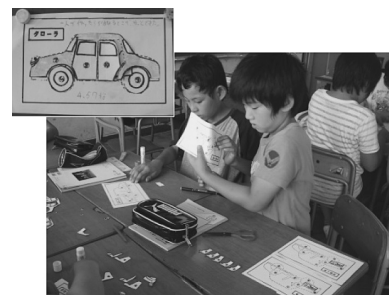
図2 分業での自動車作り

自動車工業における分業生産を体験的に学ばせるため、単元の導入として自動車のペーパークラフト作りを行った。(図2) まず、5分以内に完成させることを目標に1人に1台を作らせた。時間以内に完成できた子どもが10人であった。次に、どうしたらもっと早く、正確に作るができるか考えさせると、「分けて仕事をする」という「分業」に気付く発言があった。そこで、4人または5人グループを組み、今度はグループの全員が1台ずつ、5分以内に自動車を完成できるように分担を決めさせた。「のりを付ける役」、「タイヤを付ける役」、「ドアを付ける役」など、それぞれグループなりに工夫した分担の仕方を話し合っている様子が見られた。分業を取り入れた2回目の自動車作りでは、1人での作業に比べ、ほとんどの子どもが手際よく集中して作業に取り組んでいた。5分以内に完成できたグループは4グループ、人数では16人という結果だった。さらに1分の延長で全員が完成させることができた。