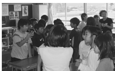
全員で正解しよう

「あめんば 赤いな あいうえお」のようなリズムよい詩や日本の名文などをペアまたはグループで息を合わせて読む。