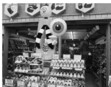
写真2 水木しげるロードの店