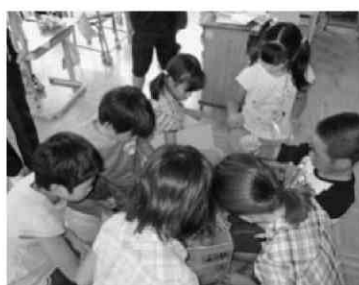
写真3 販売用ジャガイモ袋詰め