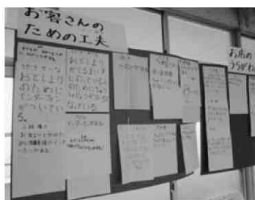
写真1 店の工夫を短冊に

授業者が調査した「水木しげるロード」の写真とビデオを見せた（写真2）。「イチコスーパー」「道の駅あらい」にはない工夫に気付かせなかったからである。特に、子どもたちが喜ぶような工夫や地元の特色をテーマにした工夫である。シートに工夫を書いた