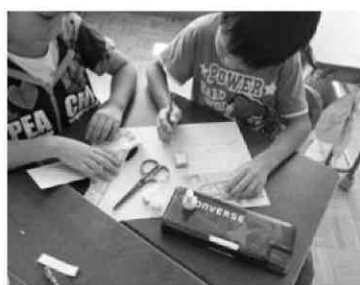
写真4 スタンプラリー準備