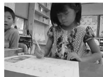
図5 聞こえた音とその理由を書いている様子

身体表現を行ったことでほとんどの子どもたちはすぐに自分が絵から感じた音をワークシートに書いていた。さらにその理由を書くことでさらに題材となる絵本の場面を深く味わっていた。「どうしてその音が聞こえたんだろう」とじっくりと絵の様子などを見ていた。早く書けた子同士でお互いにどんな音が聞こえたか、どうしてその音に聞こえたのかを話す時間をとった。「ほくも同じように聞こえたよ」「わたしは、何かが光っているように見えたよ」など自分が感じたことと照らし合わせて、楽しそうに話したり聞いたりしていた。(図5)