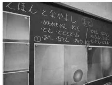
図7 児童の発言を板書したもの

前時にそれぞれで作成したフロッタージュの作品をいくつか全体の前で紹介していった。(図9) 擦りだしたフロッタージュの模様面の面白さとともにそこから友達がどんな手ざわりを感じたのかを味わわせる。出てきた手ざわりを表す言葉は、「つるつる」「でこぼこ」「ざらざら」「さらさら」「ちくちく」など様々であった。友達のフロッタージュの作品とさわった感じを表す言葉を照らし合わせて、「〇〇くんの作品は、本当にざらざらした感じがするね」「でこぼこしているのが模様からもわかるね」など自然と話し始める子どもの姿があった。前回の「えほんとなかよし」の学習を通して、自分が感じたことを素直に発言する意識が高まっていると感じた。また、前時の活動をふり返り、それぞれの感じ方を認