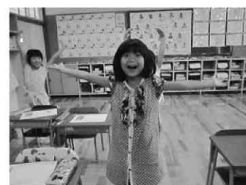
図4 絵に合わせて身体表現をしている様子

低学年の段階では、鑑賞においてこの身体表現も有効な手段だと考える。子どもたちは、自ら体を動かして表現することによってそのものを能動的にとらえようと