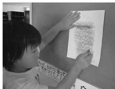
図8 フロッタージュしている様子