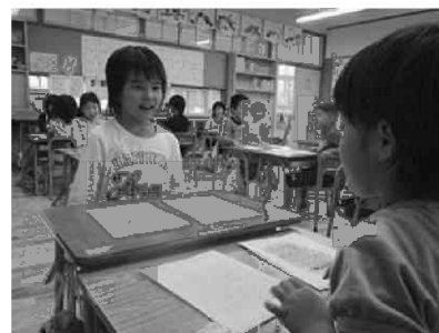
図12 カードで交流している様子