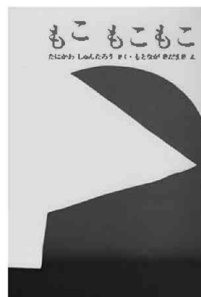
図1 絵本「もこ もこもこ」