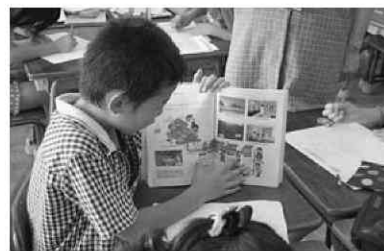
図3 伝え合いの様子

伝え終わった後に賞賛し合う活動では、カードに発表者のよかった点を書いて、お互いに読みながら渡していった。カードには、発表の仕方と発表内容の2つについてよかった点を書くように伝えた。実際には以下のような内容が書かれていた。