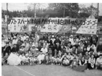
【写真1 閉校記念大運動会】

当日は120名（例年は80名程度）が集まった。児童が懸命に行う応援風景を見ていた参加者が、徐々に紅白の両軍に分かれて児童と一緒に応援を始める場面も見られた。運動会の最後には、地域の民謡である「津南音頭」に合わせて踊るというプログラムがあったが、振付を知らなくても誘われるままに皆と一緒に踊りの輪に加わった参加者もいた。「これを種目の参加賞として出して欲しい。」と、勤務先のホームセンターの日用品類を何十点も寄付した住民もいた。終日、歓声がグラウンドに響き渡った。