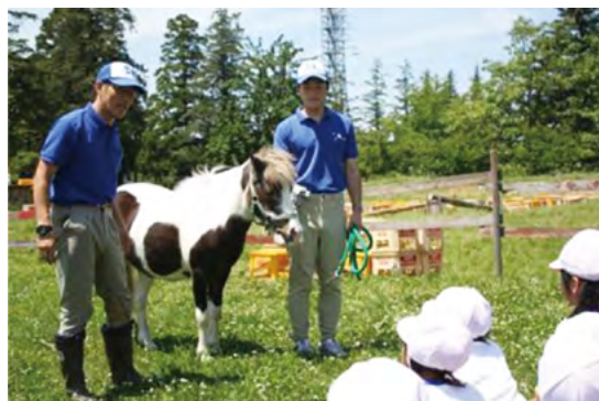
写真1 スタッフから説明を受ける児童

A男はスタッフの話真剣な表情で聞いていた。A男は次の日から毎朝登校するとすぐに原っぱへ行き、ポニーに朝の挨拶をし、餌を与えることが日課となった。A男は「ポニーと仲良くなりたい、ポニーと心を通わせたい」と願い、そのためには毎朝ポニーのところへ行き、声をかけることでポニーに自分のことを覚えてもらいたいと考えたのである。後日、A男は活動を振り返る作文に次のように記述している。