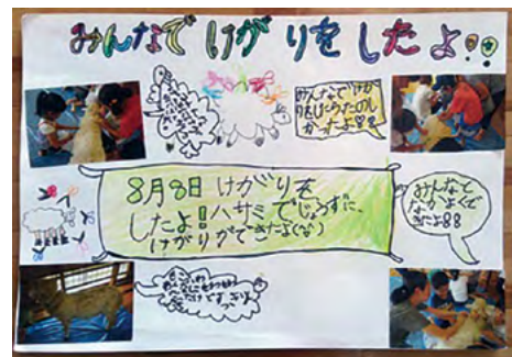
写真6 F子たちが作成した毛刈りの思い出アルバム

卒業式当日児童はプレゼントを渡したり歌を歌ったりするなどして羊とのお別れをした。F子は羊と別れた後、作文シートに次のように記述した。