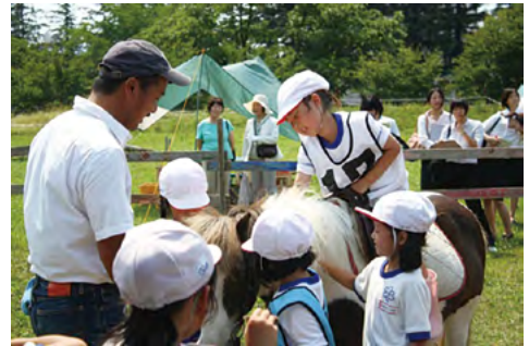
写真2 乗馬後ポニーに声をかけるB子

この活動の後、それまでは世話自体を楽しく、遊びのようにとらえていたB子たちは「乗せてもらうんだから、ちゃんとお世話をしなきゃ」「ポニーが喜んでくれるように馬房をきれいに掃除しよう」と、互いに声をかけながら世話に取り組むようになった。B子は1学期の活動を振り返り、作文に次のように記述した。