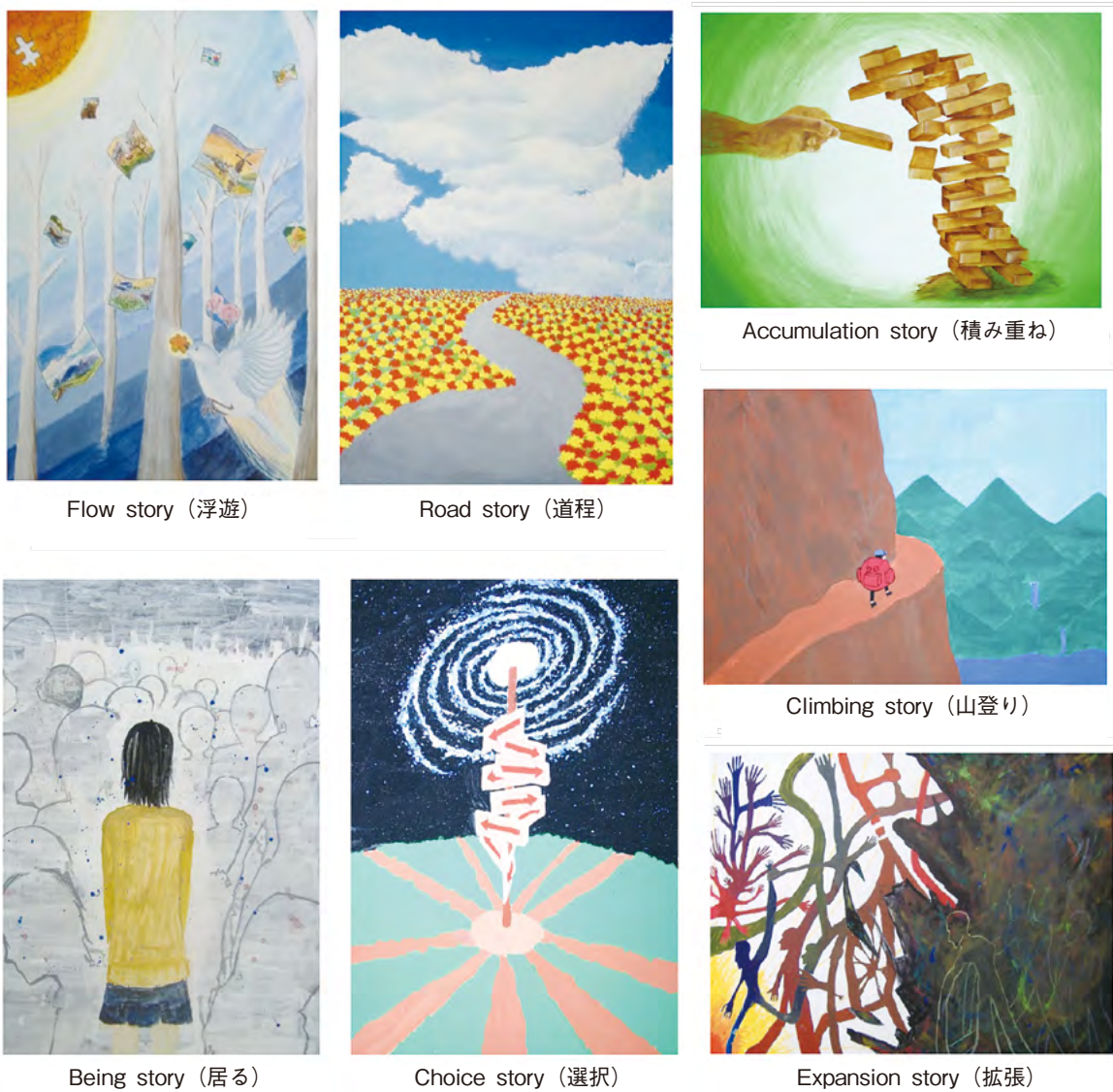
図1 中学生が描いたキャリアイメージ