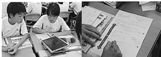
動画を視聴する生徒 様々な裁判制度の実態を知る

収集した情報を基に、まずは個人で考えをワークシートにまとめ、個人の考えを持ち寄り、グループ内で意見交換を行った。「国民を裁判に参加させるべきか?」を課題とした2班は、国民が裁判に参加した場合と参加しない場合のメリット・デメリットを中心に話し合った。「裁判官以上に様々な経験や価値観をもつ国民が参加した方が、世論を広く反映できる」という点については、メンバーの4人全員が納得し、「国民は裁判に参加した方がよい」という立場を示したが、「現在の制度では、辞退が困難」「事案によっては、心労が大きい」「裁判に関わりたくない人もいるので強制はよくない。裁判員を嫌々務める人にも、そういう人に裁かれる被告人にとってもよくない」といった主張も出された。その結果、「参加することのデメリットを何らかの形で補うことができるならば、国民の参加は賛成だが、現状では裁判官裁判で行うのがよい」という結論に至った。話し合いに際して、必要な情報をホワイトボードに書き足したり、互いの主張の根拠を聞き合ったりする姿が多く見られた。他のグループにおいても、完全な合