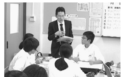
ゲストティーチャーに質問する生徒