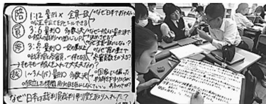
裁判制度の問題点をまとめる グループの課題を設定する生徒