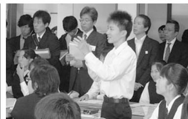
自分の考えを発表する生徒

「まとめ・表現」の各段階を終えたあとの評価では、A評価の生徒は88%であった（生徒の姿、ワークシートの記述などを基に評価）。B評価の生徒は、考えの再構築にまで至ったところがレポートからは読み取れなかった。