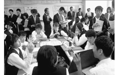
ペアグループ同士の意見交換の様子

続いて、他のグループの議論の内容を全体で共有するために、グループ代表からペアグループとの意見交換の様子を聞く場が設定された。話し合いの過程で交わされた意見と、それを受けてグループで話し合った結論について、各ペアグループ5分ずつで発表を行った。2班は、1班との話し合いやゲストティーチャーとのやりとりを通して、「公正の立場から、裁判員を引き受ける・引き受けないの意思決定や学歴で制限することについて、グループ内で意見が分かれるようになったこと、公正を守ることと、裁判員をしたくない人の気持ちを守ることのどちらを優先したらよいかが決まらなかった」と報告した。この発言を受けて、他のグループからも「同じ状況が自分たちのグループでもあった」「やりたくない人にさせるのはよくない」「でも、義務だからそれに応える必要があるのでは？」などの意見が挙がった。ここで、ゲストティーチャーから現場での経験談を基に、公正な裁判を行う上での課題だと感じていることを聞くこととなった。ゲストティーチャーからは、これまでの生徒のやりとりの中で気になった点や裁判員裁判の趣旨、実際に現場で課題となっていることについての説明がなされた。その中でも、「司法（裁判）の中で一番大事にされなければならないのは、被告人の立場だ」という説明がなされると、改めて自分たちのグループの主張を読み返す姿が見られた。専門家の意見等も参考に、裁判員制度の在り方について再度話し合い、自分の意見を述べ合う課題が示された。「自分が被告人だったら、裁判官に裁いてほしい」「でも、裁判官は法律のプロではあるけれど、仕事上、世間一般の人との関わりが少なく、一般人の感覚には疎くなりやすい」「だから、一般的な感覚を取り入れた判決にするために、裁判員裁判が採られているんだよ」と意見が続いた。「だったら、国民の義務だからそれに応えるという感覚ではなくて、裁かれる被告人のことを考えて、責任を果たすことが大事じゃないか。やりたくない気持ちも分かるし、自分も人を裁く自信は、正直ないけれど」という、ある生徒の発言に多くの生徒がうなずいた。